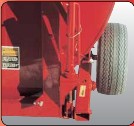
Roues ajustables pour faciliter le déplacement et l'ajustement.