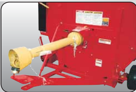
Garde sur charnière pour un accès facile du boulon de sécurité. Support de boulons de sécurité incorporé.