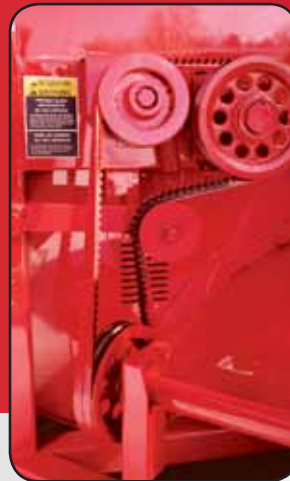
Entraînement de la vrille par 2 paires de courroies de type 5VX. Poulies doubles en fonte.