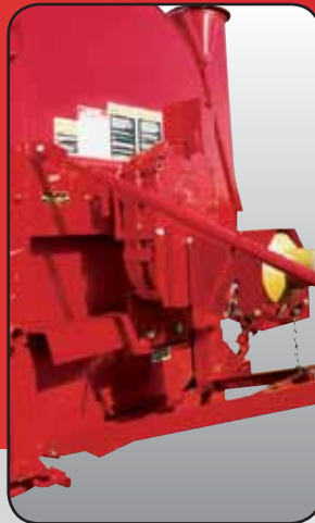
Transmission 1000 RPM du S55 HO (Réduit de 1000 à 650 R.P.M.).