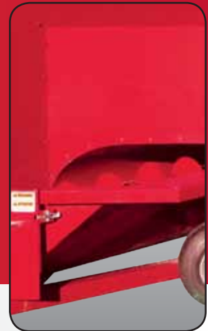
La grande tarière de 14" ou 16" assure une alimentation positive vers le ventilateur. Le système d'embrayage-désembrayage est efficace, facile d'accès et sécuritaire.